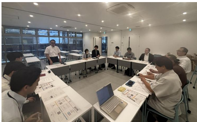
7/23 長島町町内会臨時総会で社会実験について再説明し、地域の皆さんと意見を交わす様子

今後は、通り再整備より手前にいったん立ちかえて、これまで進めてきた木質ベンチ設置や小さな緑化、「みちにわ」での道路空間活用や清掃活動などのソフト事業等に取組むなかで、地域の皆さんと現状の通りの課題や将来像を共有していくところから再出発したいと考えます。